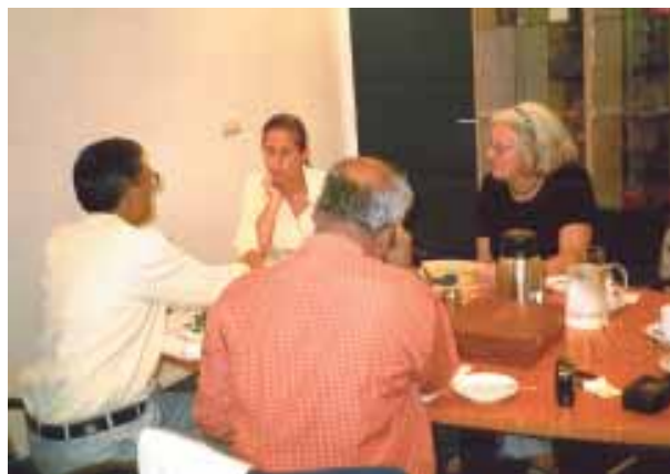
Overleg bij de Stichting Kinderpostzegels.